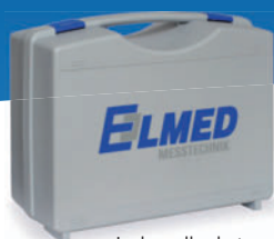
Incl. malle de transport

Système «intelligent» (par simple tournure du bouton)